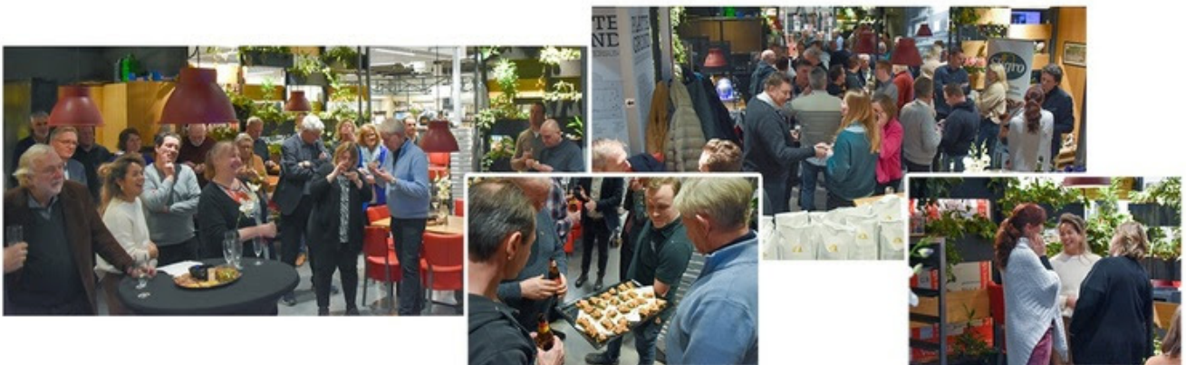
foto's Nieuwjaarsborrel 2024 bij Sligro Hilversum